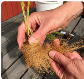
Vira kokosfiber som en krage runt rotklumpen.