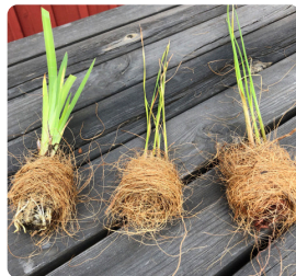
Låt undersidan på pluggen vara fri från kokosfiber.

Växterna till InterACT® levereras i brätten och plastpåse. De är numrerade och har följande uppsättning: