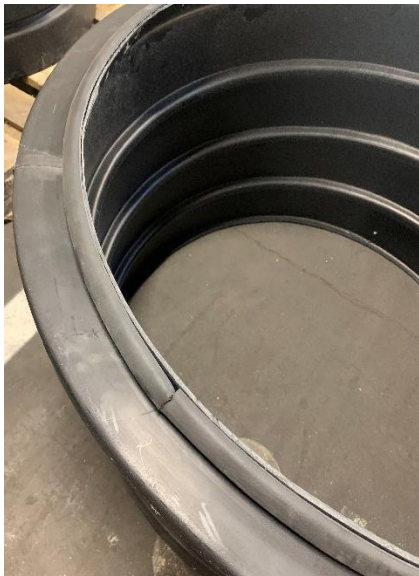
Figur 1: Fäst gummilisten mot kanten.

Börja med att limma fast den medföljande gummilisten mot kanten som Figur 1 visar. OBS! Det är alltså den sida som har en liten kant som gummilisten ska fästas mot. Denna sida kommer sedan att vara vänd nedåt mot tanken. Den andra sidan (se Figur 2) har en rundad kant, locket kommer att ligga mot denna kant.