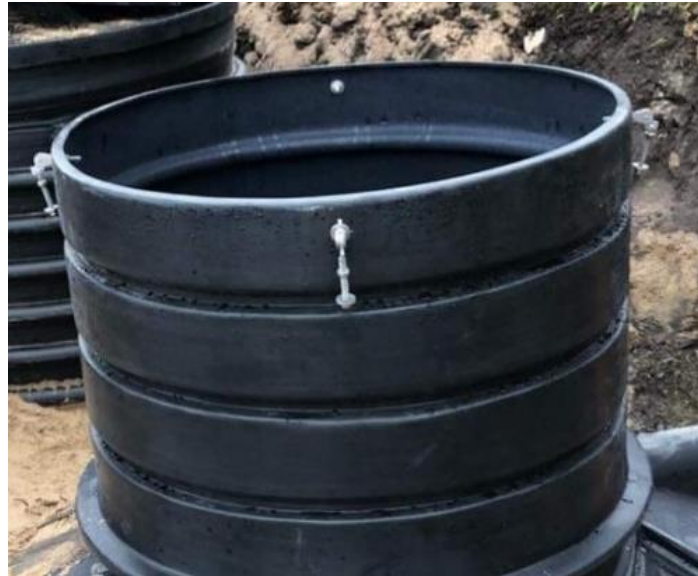
Figur 2: Ovansidan av förhöjningen är rundad.

Förhöjningen kan kapas genom att man sågar av den till önskad höjd. Man måste kapa vid någon av rillorna, så att det finns en yta för lockets gummilist att ligga mot förhöjningen.