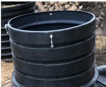
Figur 4: Fäst bultarna i överkant av förhöjningen.

Skruva fast bultarna på ovsidan av förhöjningen.