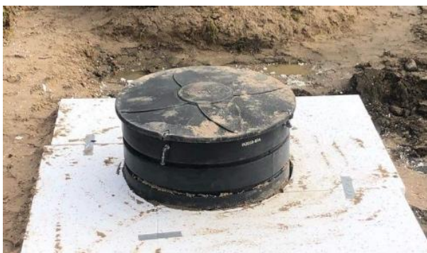
Figur 6: Avlasta med frigolit.

OBS! Viktigt att avlasta kupolen med frigolit för att minska marktrycket på tanken!